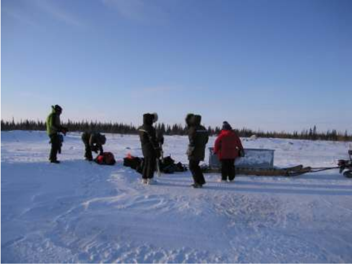
קאמאטיק און מאנטלען מיט מענטשן אינעווייניק