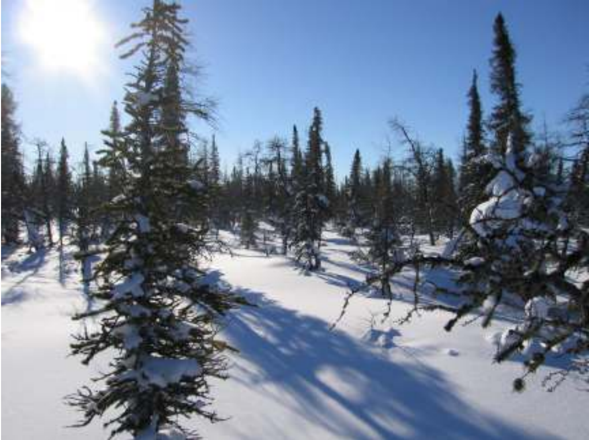
טיפֿער שניי אין די ביימער

לאַבאַראַטאָריע-אַרבעט. נאָך בעסער: דזשען האָט געענטפֿערט, אַז אויב איך וויל, קען איך בלייבן נאָך ביז שבת (באַצאָלן פֿאַרן עסן, אַוודאי). מיר איז גוט, איך בין ניט קיין יתום. האָב איך בטל געמאַכט דעם האָטעל.