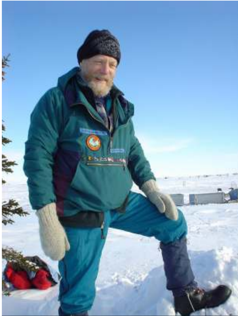
דער מחבר אין מונדיר

זייער טיפֿער שניי! ביז די פֿאַלקעס אין די טיפֿערע זאווייען. 32 צאָל מער ווייניקער אין די צוויי גריבער. נאָכן אַרבעטן האָט דזשעני געמאַכט אַ שייטערל, פֿריער אויסגראַבנדיק אַ לאַך אינעם שניי ביז צו דער ערד אונטן (אַניט וואַלט דער פֿייער זיך אַריינגעשמאַלצן אינעם שניי אַרײַן). גאָר באַקוועם, דאָס זיצן אויף אַ פֿאַר אַראָפּגעפֿאַלענע ביימער, עסן, מיטן ריח פֿון האַלצרויך אין דער לופֿטן. מיין טערמאַס האָט ניט געהאַלטן הייס דעם