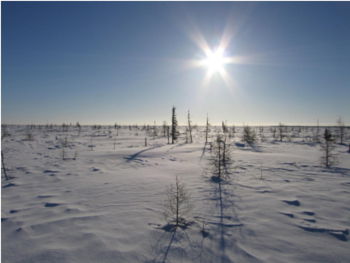
דאָס לאַנד פֿון די קליינע שטעקנס

חודש פֿעברואַר, 2005, בין איך געפֿאַרן קיין טשויטשיל, מאַניטאַבע, אויף צפֿון אין קאַנאַדע, ווי אַ וואָלונטיר מיט אַן ערדוואַך-עקספעדיציע צו מעסטן אַלערליי אַספעקטן פֿונעם שניי ביי עטלעכע ערטער דאָרט: אויף דער אָפֿענער טונדרע, אין פֿאַרפֿרוירענע זומפֿן, אין וועלדער, געזונטע און פֿאַרברענטע, אַאַז"וו. טשויטשיל איז גאַר אַן אינטערעסאַנטער אָרט אין דעם פרט, מחמת דאָס שטעטל (אַפֿשר 1000 אין באַפֿעלקערונג) געפֿינט זיך פֿונקט אויפֿן גרענעץ פֿון וועלדער און טונדרע. אויף דרום רופֿם מען דעם געגנט "דאָס לאַנד פֿון די קליינע שטעקנס".