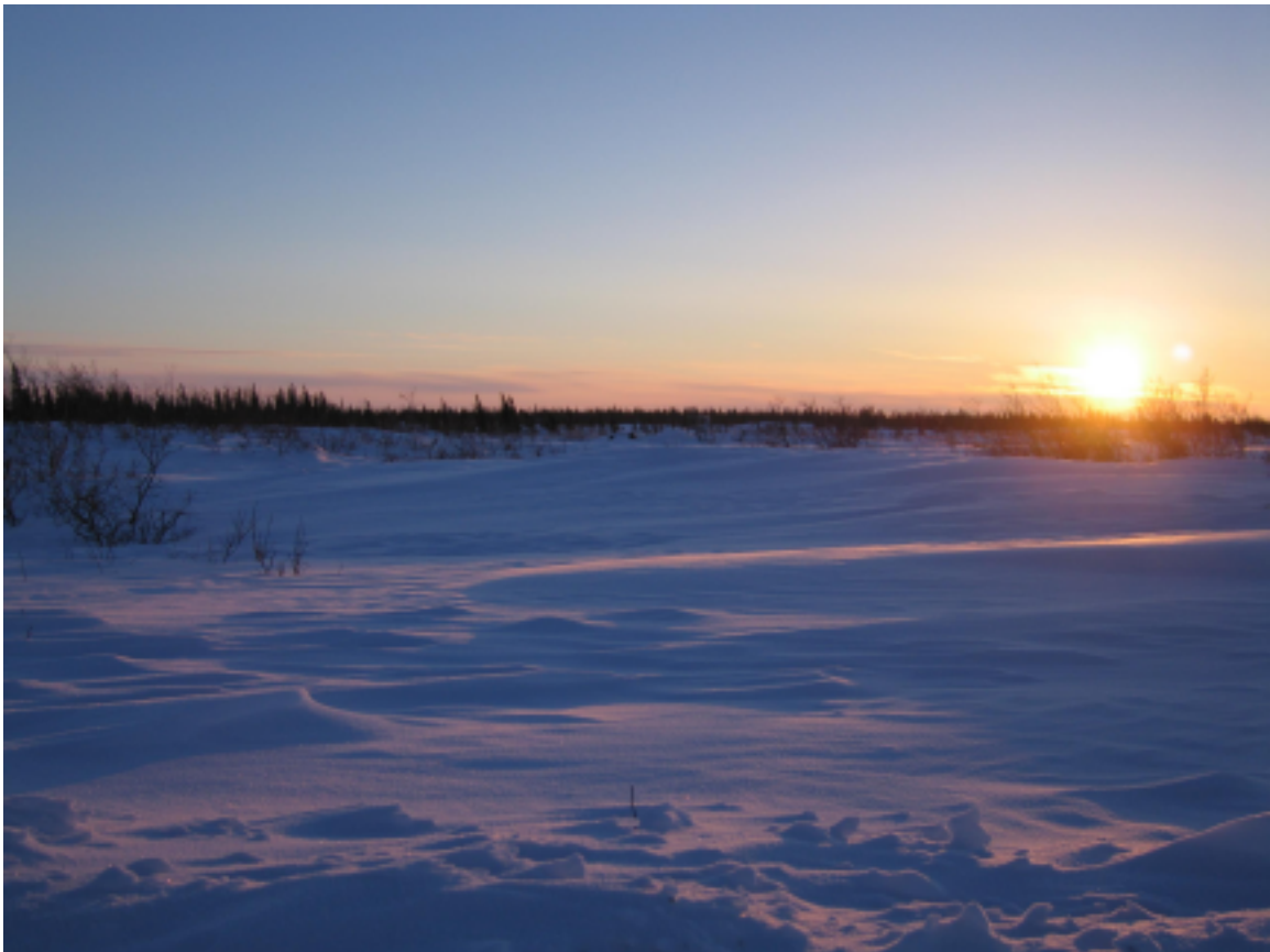
אַ האַרב נאָר שייַן לאַנד

ס'איז מיר טאַקע אַ ווונדער, ווי די העלדן פֿון דער אַרקטישער אויספֿאַרשונג, ווי אַ שטייגער, דזשאָן ריי און סאַמיועל הערן, זיינען אומעטום געגאַנגען אין אַרקטישן קאַנאַדע, צענדליקער מייל אַ טאַג, חדושים לאַנג, יאָרן לאַנג, אין אַלע וועטערן, אַלע צייטן פֿון יאָר, שלאָפֿן רוי אָדער אין אַ געצעלט, ניט קיין באַהייצטן בנין, מיט וואַרעמע הענט און פֿיס!